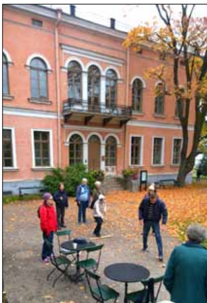
En sista chans att öka poängen gavs genom att få petanqueklottet att stanna i målringsen på villa Hagasunds gård.