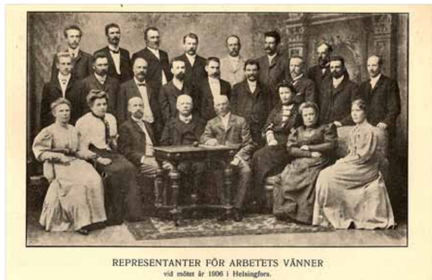
Ett par exempel ur bildserien Svenska centralarkivet sammanställt till föreningens 125-årsjubileum.