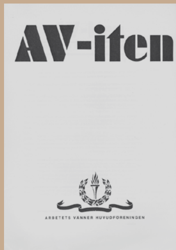
Årgång 1971, pärmen tryckt i blått, innehållet fortfarande duplicerat.